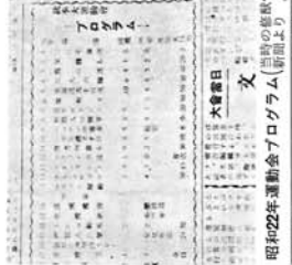
生徒主導の運動会

修猷大学の歴史は、戦前には国家主義教育の場として、生徒会もその体制に組み込まれていた。しかし、戦時体制の崩壊とともに、生徒会もまたその体制から切り離れ、独自の活動の場を求めた。この時期は、二大政党制が確立され、民主主義の精神が社会に浸透していった。生徒会もこの社会情勢を反映し、従来の生徒会活動とは異なる方向へと歩みを進めた。この頃には、生徒会が単なる学校行事の運営機関から、生徒の権利を擁護し、学校行政に意見を述べようとする組織へと変質していった。この変革の過程には、多くの困難があったが、最終的には、戦後民主主義の精神に基づいた生徒会活動の土壌が形成されていった。