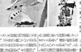
矛盾との戦い —スタンドの歴史—

修猷大学の歴史は、戦前には国家主義教育の場として、生徒会もその体制に組み込まれていた。しかし、戦時体制の崩壊とともに、生徒会もまたその体制から切り離れ、独自の活動の場を求めた。この時期は、二大政党制が確立され、民主主義の精神が社会に浸透していった。生徒会もこの社会情勢を反映し、従来の生徒会活動とは異なる方向へと歩みを進めた。この頃には、生徒会が単なる学校行事の運営機関から、生徒の権利を擁護し、学校行政に意見を述べようとする組織へと変質していった。この変革の過程には、多くの困難があったが、最終的には、戦後民主主義の精神に基づいた生徒会活動の土壌が形成されていった。